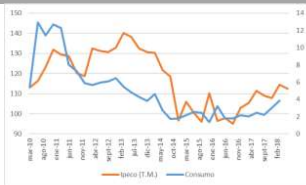
GRÁFICO 2 IpeCo y Crecimiento anual del consumo privado