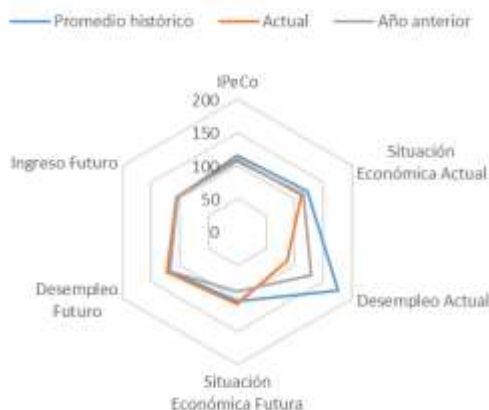
GRÁFICO 4 IPeCo y percepciones