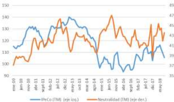
GRÁFICO 6 Neutralidad y Percepción de los Consumidores