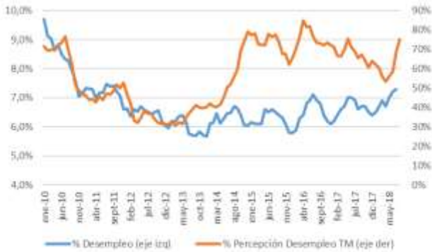
GRÁFICO 5 Desempleo y Percepción sobre desempleo actual