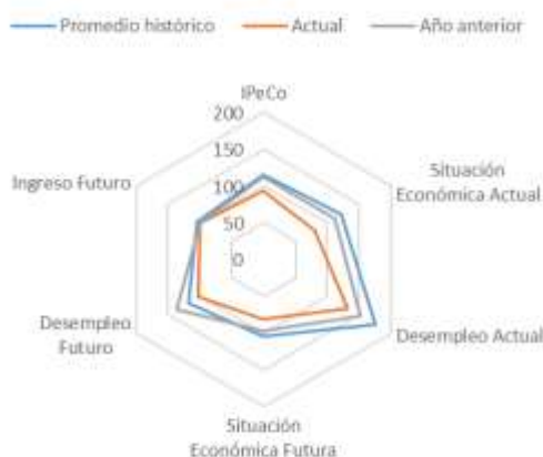
GRÁFICO 4 IPeCo y percepciones