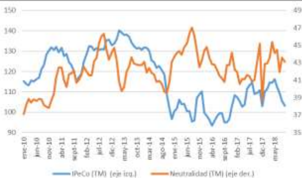
GRÁFICO 6 Neutralidad y Percepción de los Consumidores