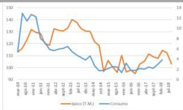
GRÁFICO 2 IpeCo y Crecimiento anual del consumo privado