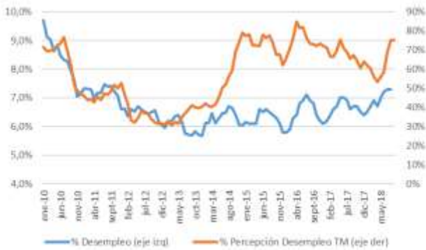
GRÁFICO 5 Desempleo y Percepción sobre desempleo actual