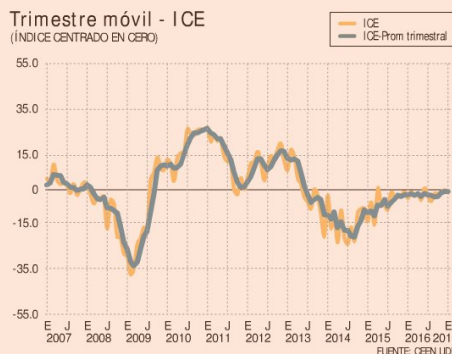
Índice de variables seleccionadas

Lo anterior, en un marco donde la inflación cerró 2016 ubicada en el rango meta, lo que se tradujo en que el