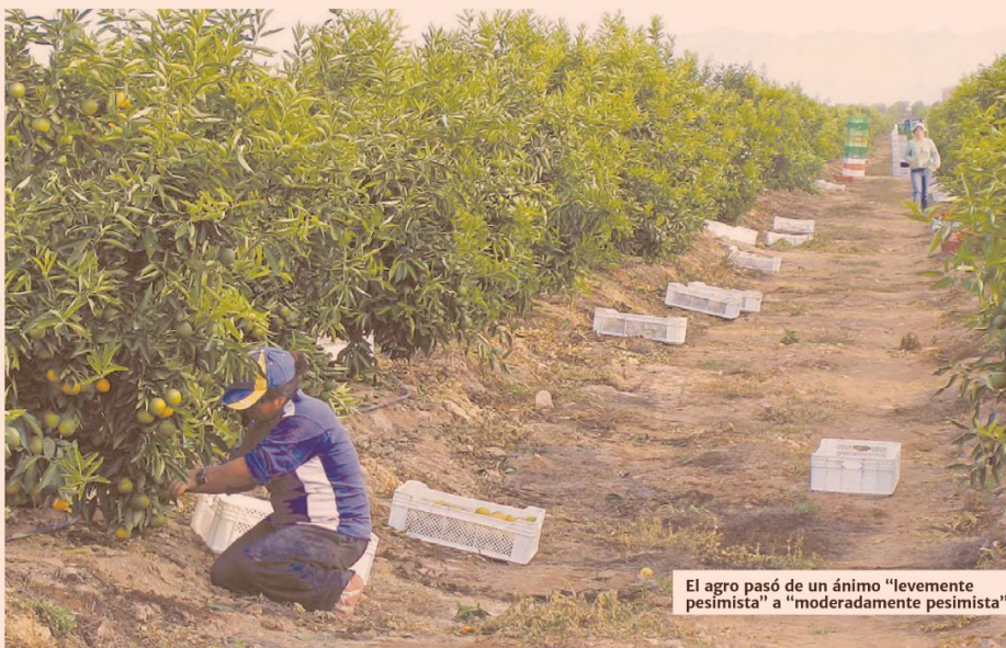
El agro pasó de un ánimo "levemente pesimista" a "moderadamente pesimista".

avanzó el ánimo en el comercio respecto de julio de 2016.