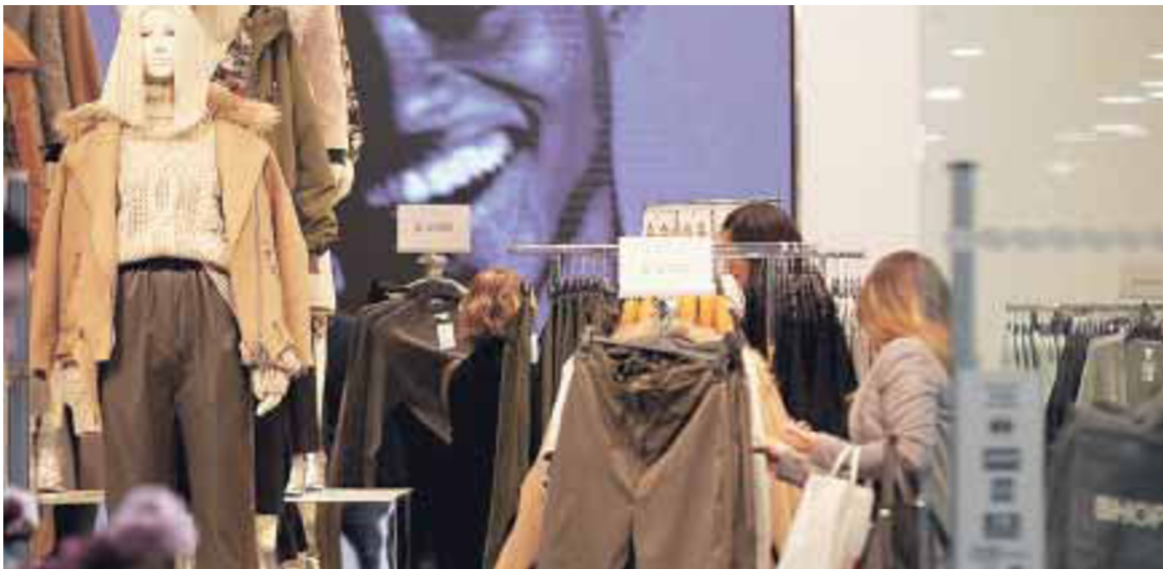
Compradores en centro comercial.