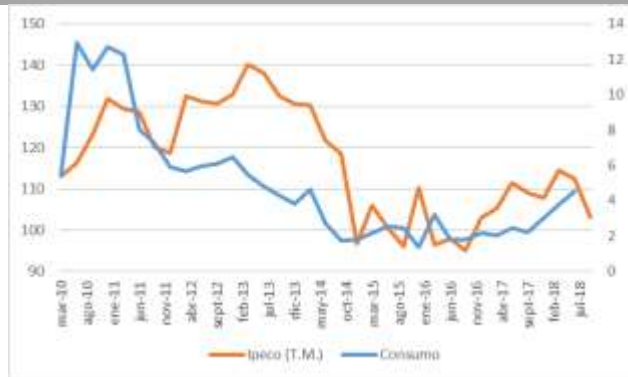
GRÁFICO 2 IPeCo y Crecimiento anual del consumo privado