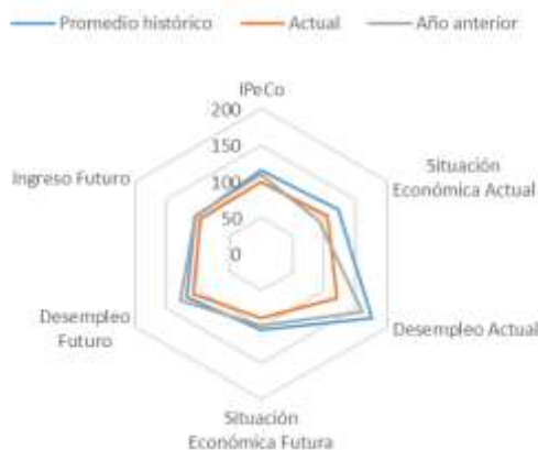
GRÁFICO 4 IPeCo y percepciones