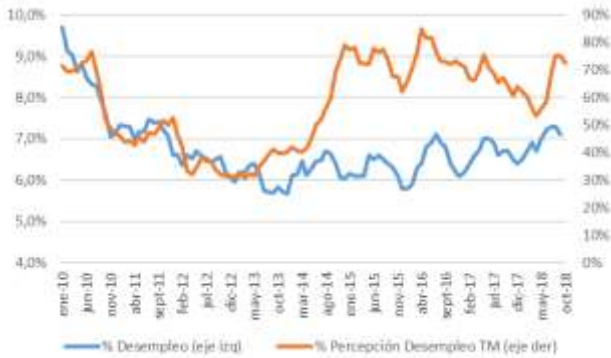
GRÁFICO 5 Desempleo y Percepción sobre desempleo actual