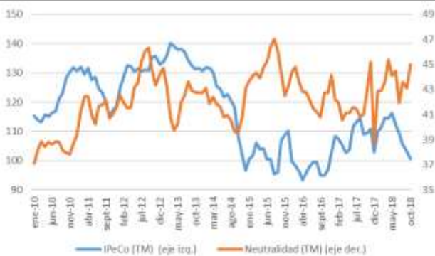
GRÁFICO 6 Neutralidad y Percepción de los Consumidores