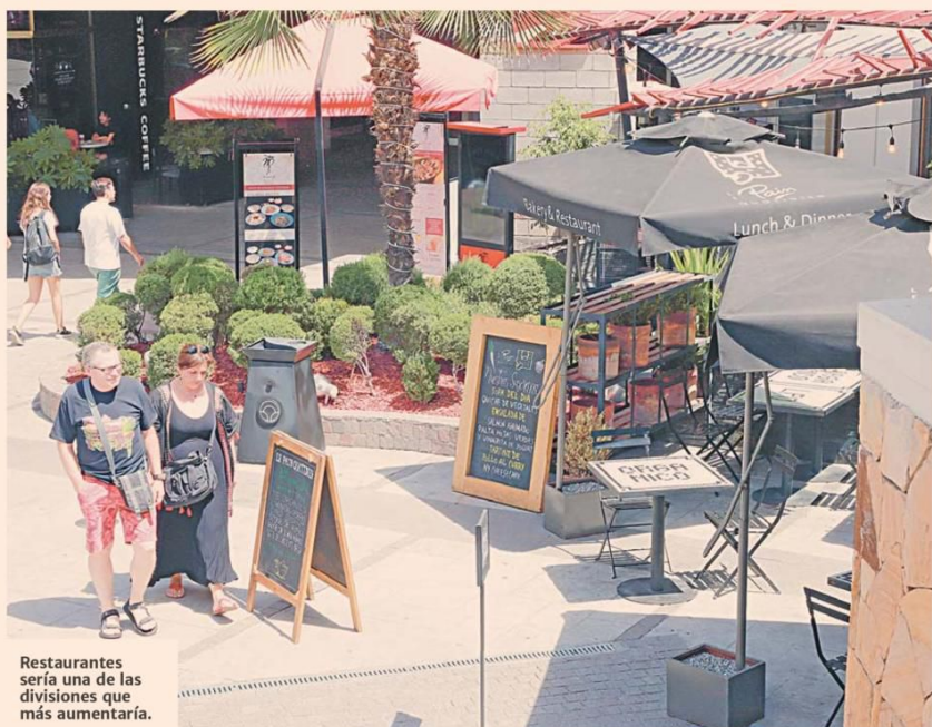
Restaurantes sería una de las divisiones que más aumentaría.

En cambio, las divisiones que reducirán su peso en la inflación total