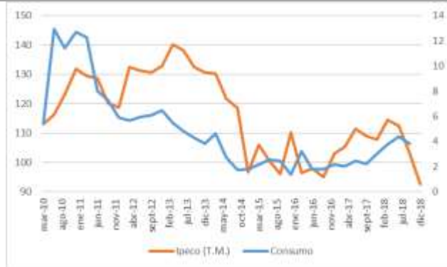
GRÁFICO 2 IPeCo y Crecimiento anual del consumo privado