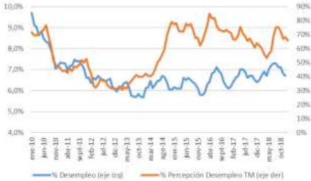
GRÁFICO 5 Desempleo y Percepción sobre desempleo actual