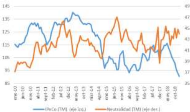
GRÁFICO 6 Neutralidad y Percepción de los Consumidores