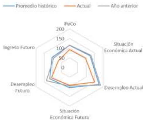
GRÁFICO 4 IPeCo y percepciones