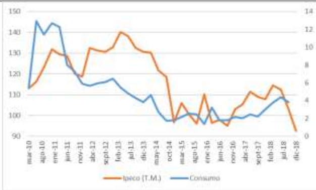
GRÁFICO 2 IpeCo y Crecimiento anual del consumo privado