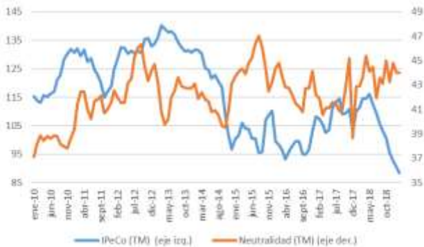
GRÁFICO 6 Neutralidad y Percepción de los Consumidores

TM = trimestre móvil