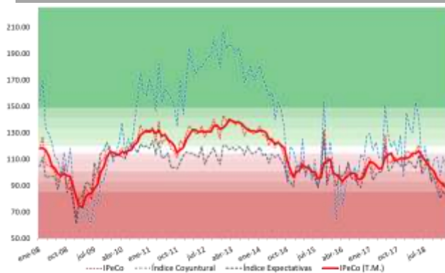
GRÁFICO 1 Índice de Percepción de Consumidores Base dic-2001 = 100