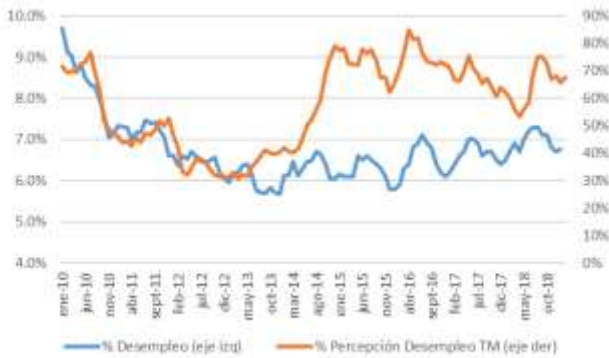
GRÁFICO 5 Desempleo y Percepción sobre desempleo actual