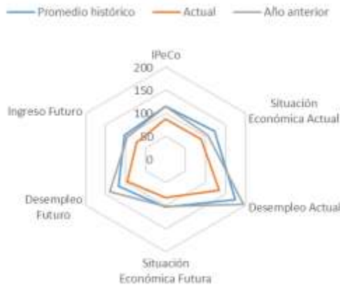
GRÁFICO 4 IPeCo y percepciones