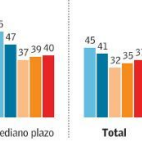
ICE NEGOCIOS Y ENTORNO