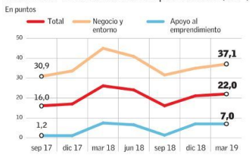
Índice de Confianza del Emprendedor (ICE)