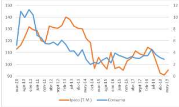
GRÁFICO 2 IPeCo y Crecimiento anual del consumo privado