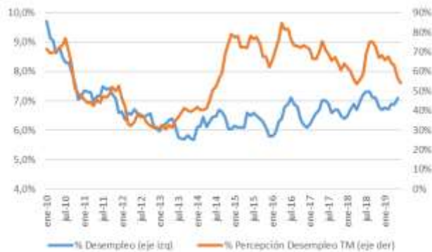
GRÁFICO 5 Desempleo y Percepción sobre desempleo actual