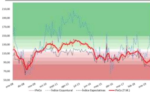
GRÁFICO 1 Índice de Percepción de Consumidores Base dic-2001 = 100