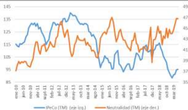
GRÁFICO 6 Neutralidad y Percepción de los Consumidores