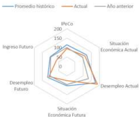
GRÁFICO 4 IPeCo y percepciones