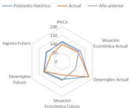
GRÁFICO 4 IPeCo y percepciones