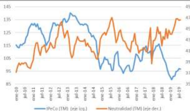
GRÁFICO 6 Neutralidad y Percepción de los Consumidores