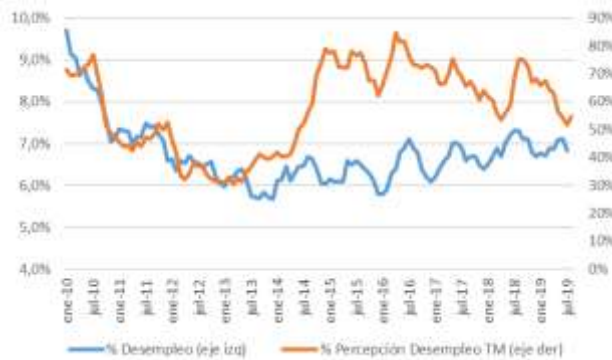
GRÁFICO 5 Desempleo y Percepción sobre desempleo actual