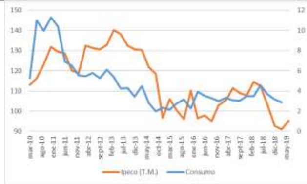
GRÁFICO 2 IPeCo y Crecimiento anual del consumo privado

T.M. = Trimestre móvil