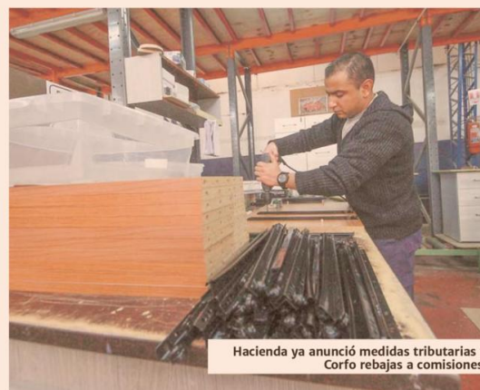
Hacienda ya anunció medidas tributarias y Corfo rebajas a comisiones.

Estas medidas se suman a las anunciadas por Corfo, como la adaptación del Programa de Apoyo a la Reactivación (PAR), que permitirá que las firmas -con ventas hasta 50.000 UF anuales- registradas en el catastro y que demuestren daños, puedan acceder a financiamiento para proyectos de asistencia técnica, inversión o capital de trabajo, con un tope de 90% de cobertura.