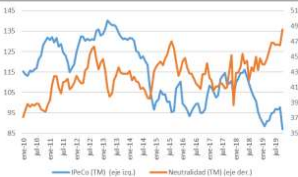
GRÁFICO 6 Neutralidad y Percepción de los Consumidores