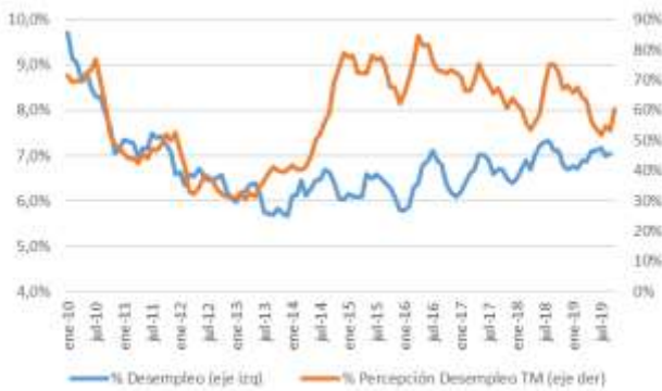
GRÁFICO 5 Desempleo y Percepción sobre desempleo actual

Fuente: CEEN UDD en base a encuestas en Mall Plaza