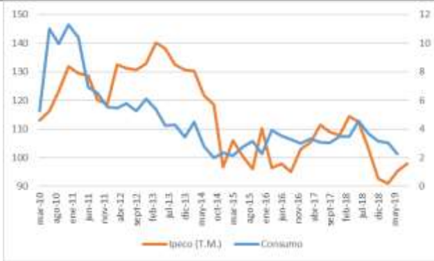
GRÁFICO 2 IpeCo y Crecimiento anual del consumo privado

T.M. = Trimestre móvil