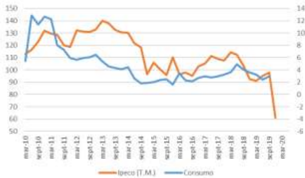
GRÁFICO 2 IpeCo y Crecimiento anual del consumo privado

T.M. = Trimestre móvil