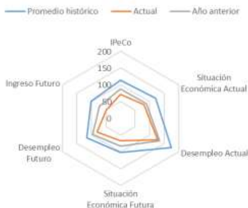
GRÁFICO 4 IPeCo y percepciones