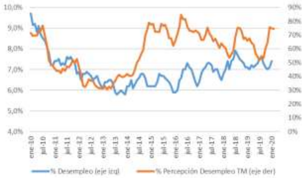
GRÁFICO 5 Desempleo y Percepción sobre desempleo actual