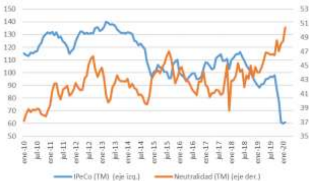
GRÁFICO 6 Neutralidad y Percepción de los Consumidores

TM = trimestre móvil